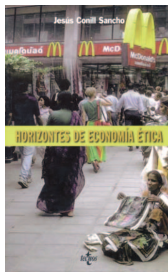
Portada del libro Horizontes de economía ética de Jesús Conill.

Todos estos aspectos están de actualidad, que no de moda, como afirma Jesús Conill en su reciente libro Horizontes de economía ética . “De moda se pone un asunto cuando durante un breve período de tiempo anda de boca en boca, pero toda su relevancia se agota en esa aparición fugaz. Una cuestión está, por contra, de actualidad cuando pertenece a la más profunda entraña de nuestro ser personas, y sale a relucir con especial notoriedad durante un período de tiempo porque algunos sucesos así lo exigen, para ocultarse de nuevo y surgir más adelante. La moral